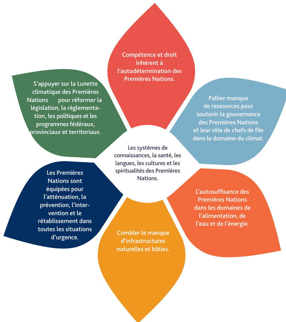
Figure 1. Les sept domaines prioritaires de la Stratégie nationale de l'APN sur le climat :

Afin de renforcer les droits, les systèmes de connaissances et l'autodétermination des Premières Nations, nous partageons cette prise de position avant la 28e Conférence des Parties (COP 28) organisée par les Émirats arabes unis (EAU) à Dubaï. Les recommandations sont regroupées en trois volets :