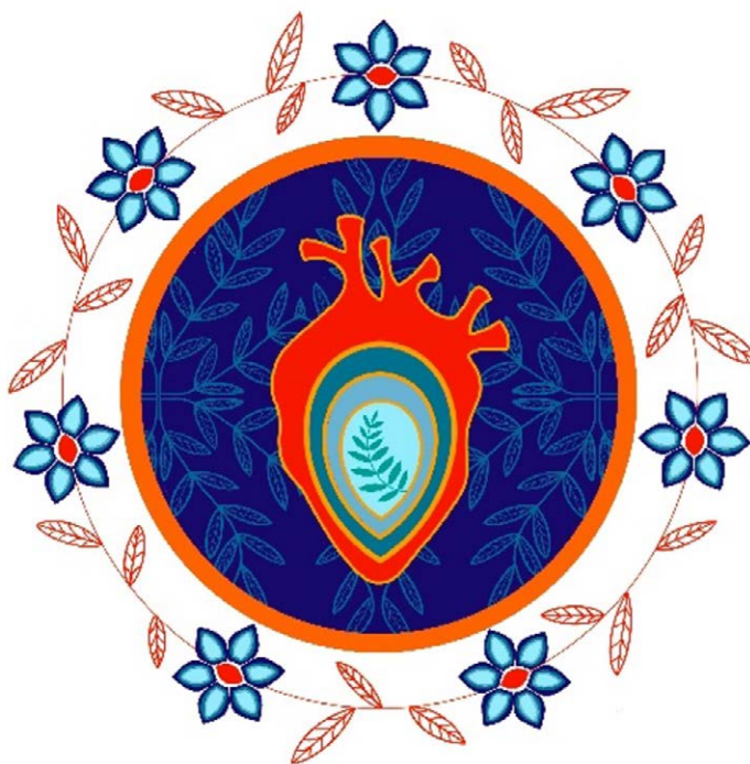
Figure 1: Logo du 3 e rassemblement national de l'APN sur le climat

Afin de poursuivre l'élan généré par le Rassemblement national sur le climat, nous partageons cet exposé de position avant la 29 e Conférence des Parties (COP 29) organisée par l'Azerbaïdjan, à Bakou. Les recommandations sont regroupées en trois volets :